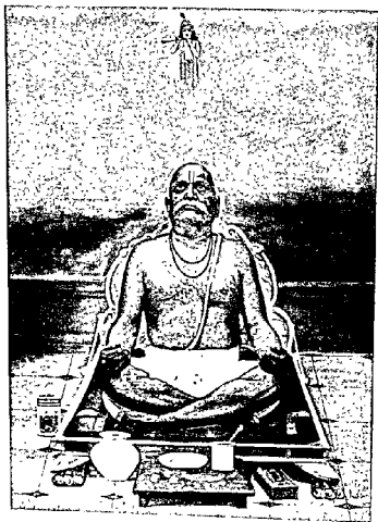
धीमंत वेदिकानुष्ठान गृहीतदीक्ष यशवन्त विष्णु नेने, मुंबई.